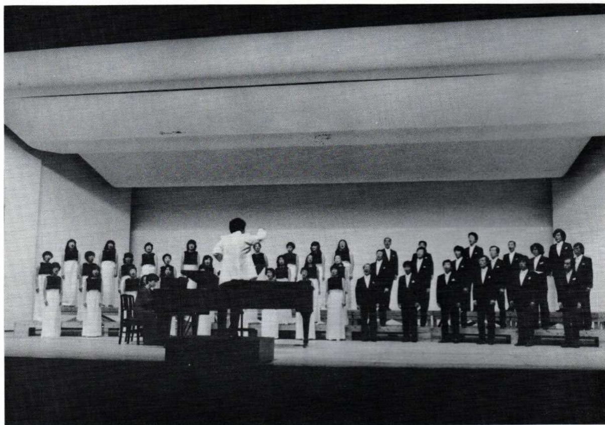
第19回定期演奏会（昭和57年9月30日）虎ノ門ホール